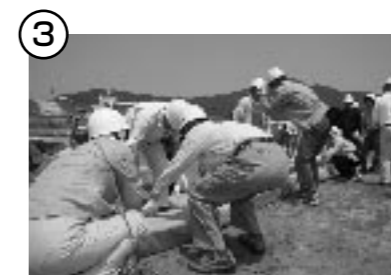
③ シートをぐるりと巻き込む。これで1段目が完成。水深に合わせて同じものを積み重ねていく。