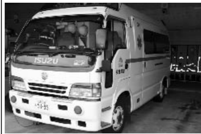
高規格救急車は、救急救命士が搭乗し、高度な救急救命処置を実施するための資器材を搭載した救急車です。

平成19年4月の運用開始に向け、美土里町北地域に安芸高田消防署の分駐所整備に取りかかります。この分駐所では救急の業務を行います。施設は美土里町北にある、元高田郡農協(現広島北部農協)北支所の跡地を活用します。ここは旧美土里町が購入し現在市の所有となっておりま