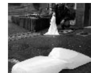
40リットル程度の大きさのごみ袋を2重にして、中に半分くらい水を入れて袋をしぼる。