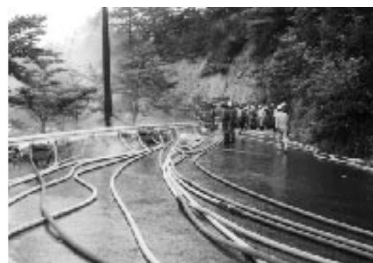
消防団、消防署、建設省の懸命な排水作業によって水位を160 cm 下げ、安全を保つことができた。

「美土里町災害対策本部より、大雨に伴う災害情報をお知らせします。美土里町横田寺奥ため池が危険な状態となり、決壊が懸念されます。避難施設を敬覚寺ならびに横田小学校に設置しています。周辺の住民の皆さんは、ただちに避難してください。あわてることなく、冷静に行動してください」平成11年7月2日の午後6時40分、美土里町内に有線放送で流された避難勧告です。