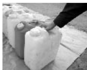
10リットル・20リットルのポリタンクに水を入れる。