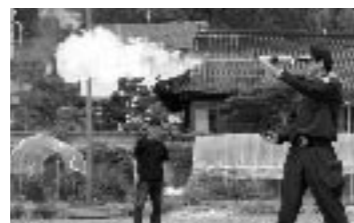
家庭の中に潜む危険として、可燃性のスプレーがどのくらい炎を放つか披露。スプレーに火を近づけないように注意が呼びかけられた。