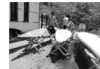
練習終了後、カヌーもパドルもきれいに水洗いをしてふく。道具を大切にすることがこのクラブのルールだ。