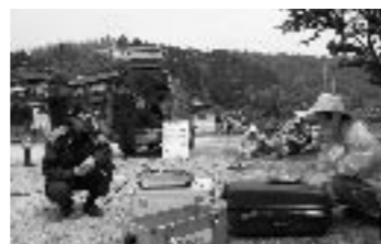
消防署の職員から、119番の通報要領や、携帯電話からも直接安芸高田消防署につながることを学んだ。