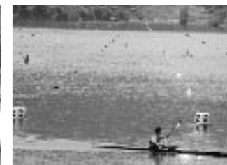
水上では必ずライフジャケットを着用する。八千代湖は直線で1,000mのコースがとれるカヌーをするにはとても優れた場所だ。