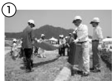
① シートを広げた上に、プランターを水の浸入を防ぎたい広さ分ほど並べる。