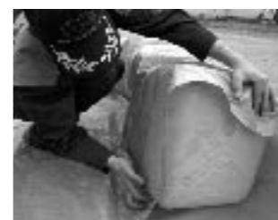
シートで巻き込み、連結して使用する。