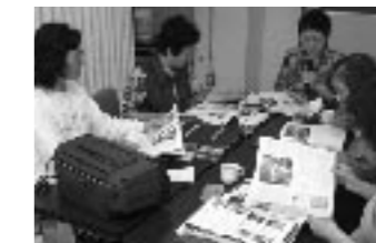
吹き込みの作業での問題は声以外の音。家ではなるべく一人のときに行うそう。