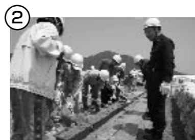
② プランターの中に土を敷き詰める。積み重ねることもできるように、上部はたいらにします。