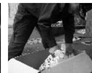
ダンボール箱に並べていくことで、強さが増し、また積み重ねることもできる。