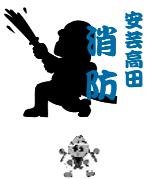
安芸高田市消防本部・安芸高田消防署 TEL 42-0931 FAX 47-1191 ホームページ http://www.akitakata.jp/119/