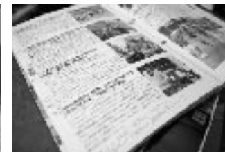
より聞きやすく読むように、広報には鉛筆や赤いペンでしるしがつけられていた。