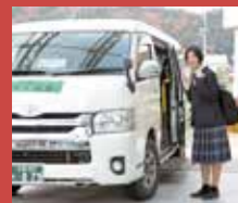
〈今月の表紙〉 「お太助ワゴンを利用する高校生」