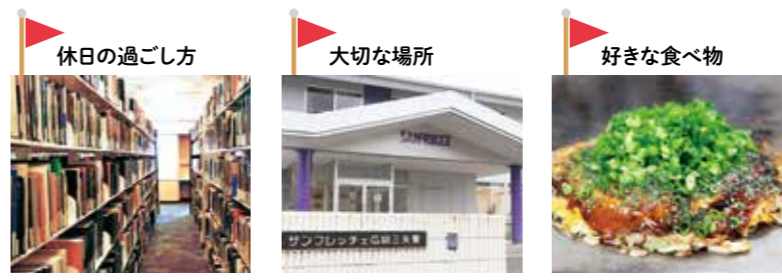
図書館や書店で本を見て回るのが大好き。シーズンオフには幅広いジャンルの本を読みあさります。 選手と多くの時間を過ごす三矢寮。指導者としてのイロハをたたき込まれた場所でもあります。 選手時代から通い続けている「大ちゃん」のお好み焼。最近は辛麺のお好み焼にハマっています。