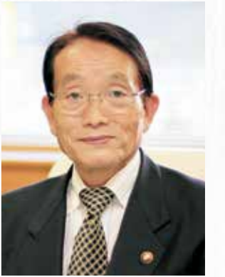
安芸高田市長 浜田一義

新年明けましておめでとうございます。安芸高田市民の皆様にご挨拶申し上げます。平素は、市政推進に對しましてご理解とご協力を賜り心より厚くお礼を申し上げます。