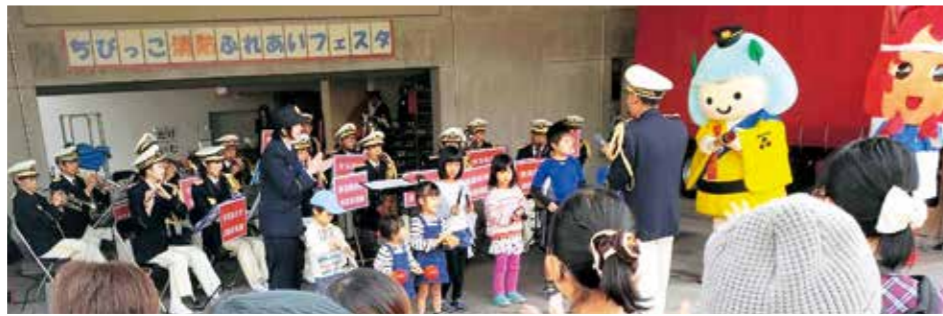
安芸高田市消防音楽隊とちびっこコラボレーション!

安芸高田市消防本部では、秋の火災予防運動中の11月11日(日)、市民の防火・防災意識の向上を図り、幼年期の消防・防災の知識と関心を深めることを目的に「ちびっこ消防ふれあいフェスタ」を開催しました。市のマスコットキャラクター「たかたん」に1日消防署長を委嘱し、延べ600人を超える来場者が様々な消防体験にチャレンジ。楽しみながら火災予防を学びました。