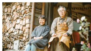
a./地域の人の集まる納屋。過ごしやすいようまだまだ改修を続けている。b./この薪ストーブに出会うまで、いくつものメーカーを巡った。c./外観はそのまま。山から切り出してくる薪も丁寧に、丁寧に積む。d./土とレンガで手作りのピザ窯。