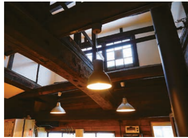
改修前は見えなかった窓。真ん中に木がはめてあるのも、また味。