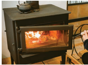
冬、薪ストーブをつけておくと、次の日の朝まであたたかい。