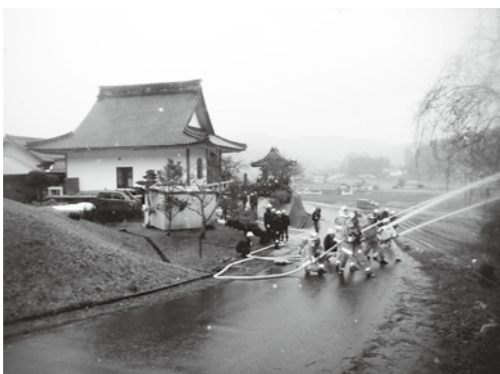
平成26年訓練の様子 (高宮町羽佐竹 万福寺)

文化財防火デーは昭和24年1月26日に、法隆寺金堂が炎上し、壁画焼損したことに基ついています。このような被害から文化財を守るとともに、国民一般の文化財愛護に関する意識の高揚を図るため、昭和30年から、1月26日を「文化財防火デー」と定めて、文化財防火運動を全国で展開しています。