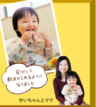
安心して 飲ませられるよう になりました

紙パックの こぼさない飲み方 紙パックのジュースを子どもに飲ませるとき、強く握ってストローから噴き出してしまうことがよくあり困ってました。そんなとき、友達ママから教えてもらったのがこの方法。紙パック上部の折りたんである部分を開いて持ち手にするので、子どもが強く握っても中のジュースがこぼれません。