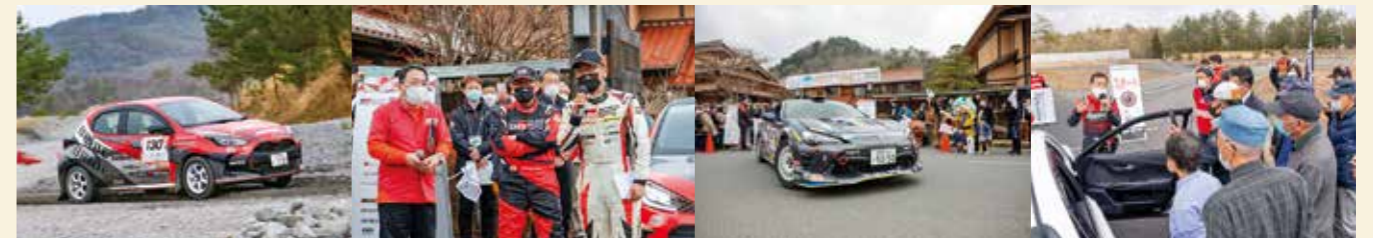
前日には大会に先駆けて高齢者向けのドライバー講座「グッドドライバーレッスン」も開催されました。