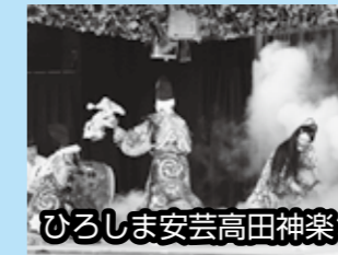
ひろしま安芸高田神楽