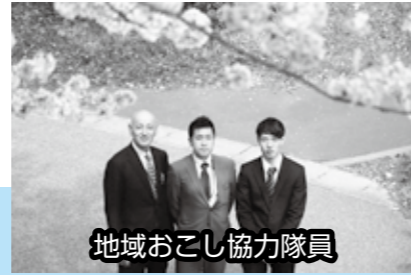
地域おこし協力隊員