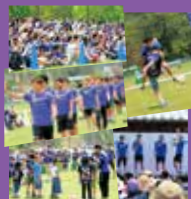
(今月の表紙) サンフレッチェ広島 ファン感謝デーの様子