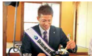
初めて夜叉うどんを試食。「ピリ辛でやみつきになりそう」と絶賛。