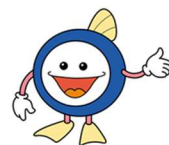
下水道マスコットキャラクター 「スイスイ」