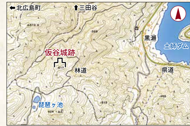
周辺位置図(国土地理院地図に加筆)

立地と歴史 土師ダム湖畔の黒瀬地区から直線で西へ1.3kmの山深い地にあります。近くに林道が通りますが、集落と隔絶した山頂部という特異な立地です。半径2km圏内には他に城跡も無く、孤立した城のようにも見えます。歴史は不明ですが、江戸時代後期の『芸藩通誌』掲載の絵図に、「陣ヶ丸城跡」とあるのが仮谷城を指すとも考えられます。