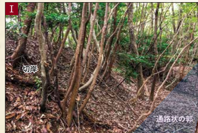
I 北側の鋭い切岸と細長い通路状の郭(東側から撮影)

遺構 遺構は東西30m、南北20mのIを中心にその周囲の細長い通路状の郭で構成されています。Iの西端に堀切があります。東端もわずかに堀切と削った切岸がよく残り、見応えがあります。また、東側の尾根続きに、粗く小さな平坦地が幾つかあります。三田谷方面を意識した構造です。