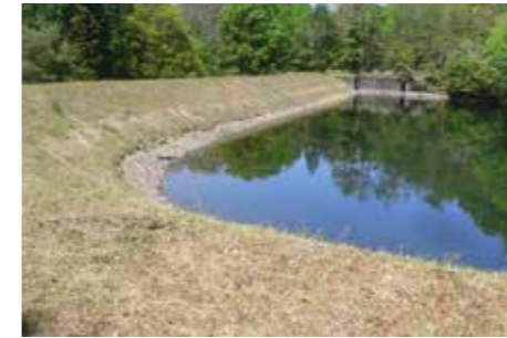
適正に管理されているため池

ため池を所有している方は、梅雨時期・台風時期に備え、ため池の適正な管理に努めてください。管理を怠ると、ため池の決壊などで下流域へ多大な被害を及ぼす危険性があります。