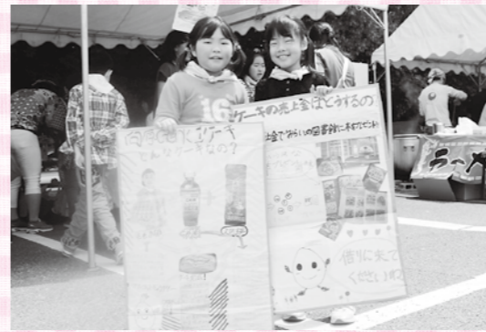
第6回アートまつりでの一コマ(4月27日(日)撮影)。