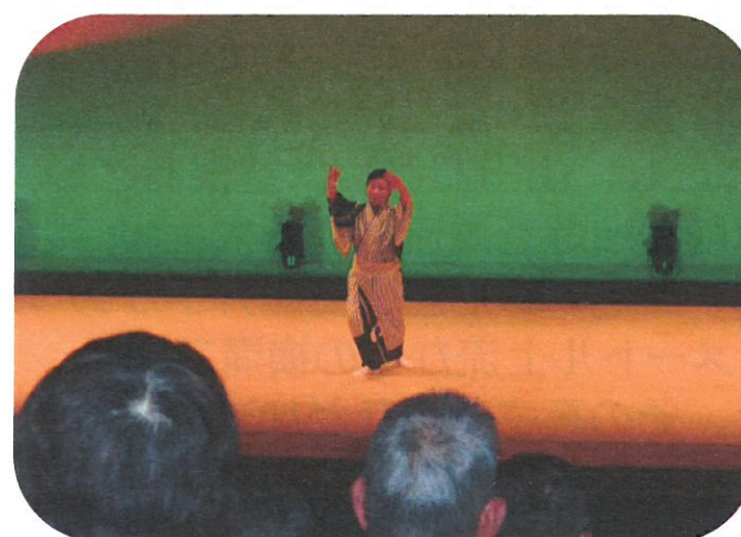
叡心会向原教室による「詩舞 孫」 円熟の舞はさすが！