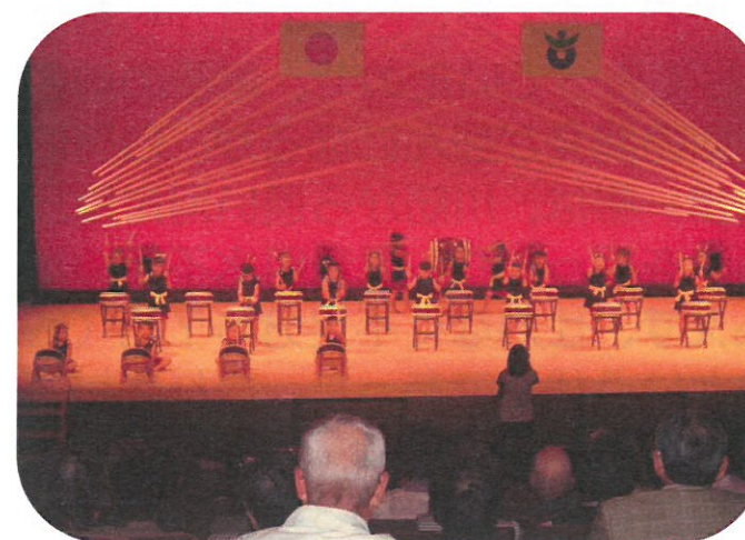
こばと園児による『こばと太鼓』 年長のぞう組がハッスル！

こばと園ぞう組園児による「こばと太鼓」、向原中学校3年生生徒による「丸山太鼓」、叡心会向原教室による「詩舞 孫」、向原民踊教室による「民踊 鳥海山」、安芸高田警察署による「高齢者安全・安心川柳表彰式」、深瀬ひよっこ同好会による「ひよっこ踊り」、ヒロシマ国際平和文化活動団体認定の広島ジュニアマリンバアンサンブルによる演奏などが披露され、敬老会参加者247人の皆さんは楽しいひとときを過ごされました。