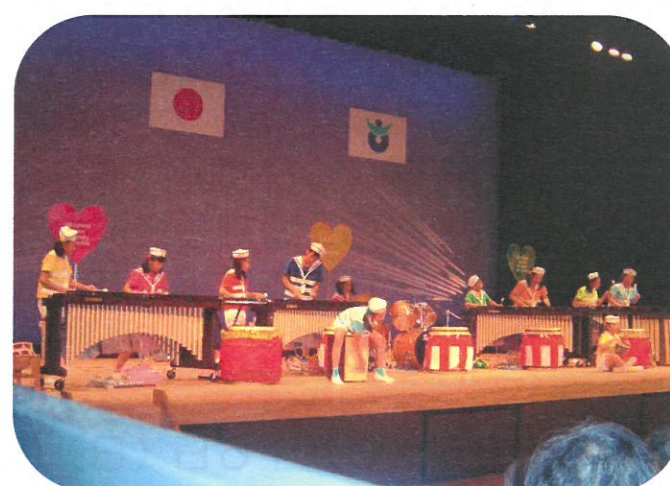
広島ジュニアマリンバアンサンブルによる マリンバ演奏、感動の奏楽に大拍手！