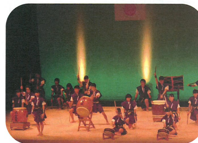
向原中学校3年生生徒による「丸山太鼓」 きびきびとした動きが爽やかでした！