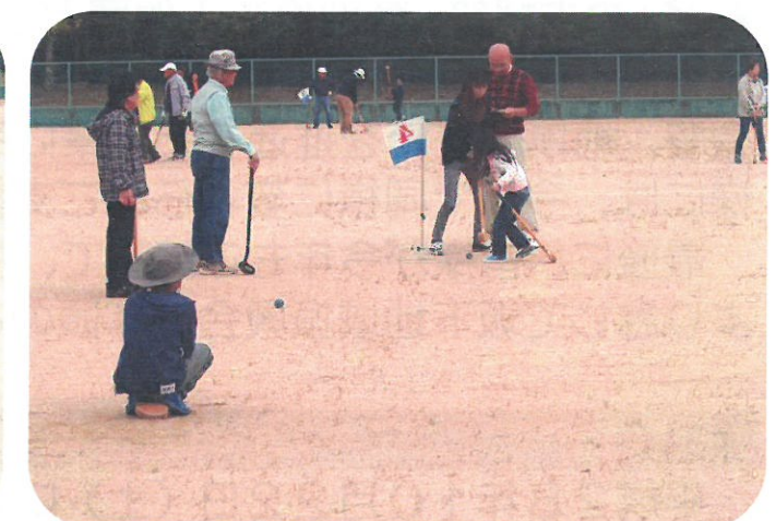
みんなで盛り上がりました。楽しかったね!