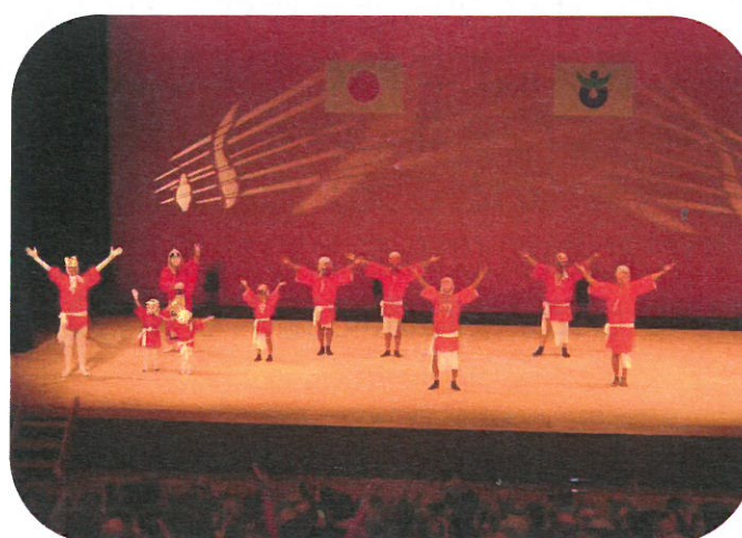
深瀬ひよっこ同好会による「ひよっこ踊り」 愉快的な踊りに笑顔が満開でした！