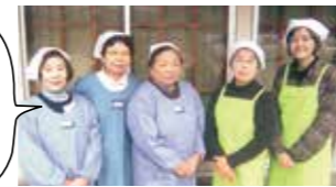
安芸高田市食生活改善推進協議会 向原支部