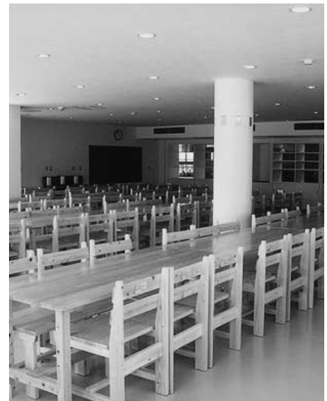
間伐材利用で机・イス(少年自然の家)