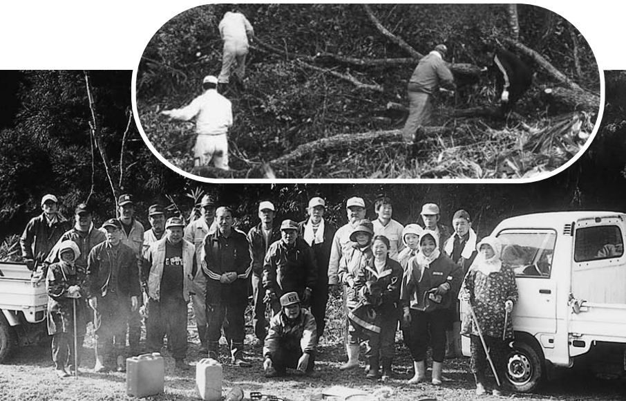
里山林整備にとりくむ高田原16区の皆さん

私たちの住む安芸高田市は、約79%を森林が占め、緑豊かな生活環境を形成しています。 この貴重な森林を守り育て、健全な状態で22世紀の市民へ引き継いでいくため、広島県が導入した「ひろしまの森づくり県民税」の財源を活用して、振興会等が生活環境の保全、自然とのふれあいの場の提供及び鳥獣害防止等を目的として地域の里山林野整備活動を援助するのが「ひろしまの森づくり事業」です。