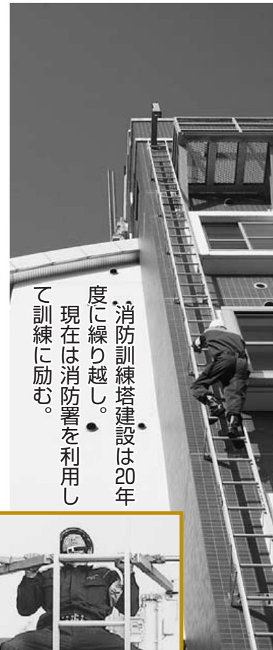
消防訓練塔建設は20年度に繰り越し。現在は消防署を利用して訓練に励む。