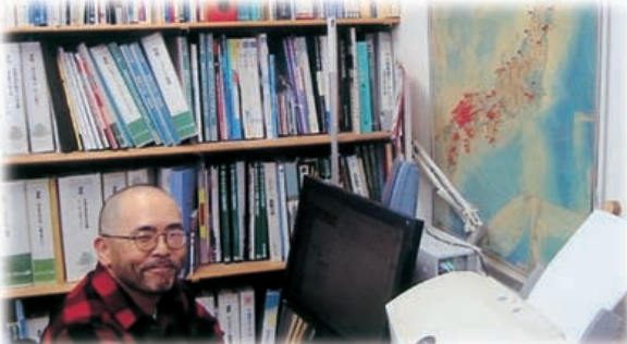
美土里町にISDNの開局がわかり住む事にしました。 自然環境が気に入っています。