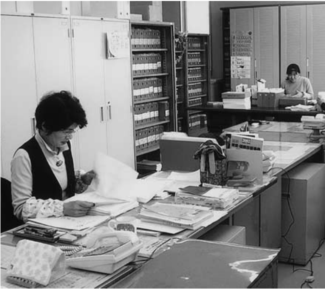
レセプト点検 甲田支所から移転

ら改修事業費の内訳と計画変更した内容について説明を受けた後、その改修状況を現地視察しました。