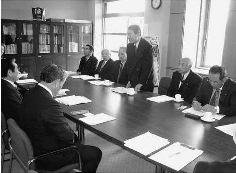
邑南町議会での研修