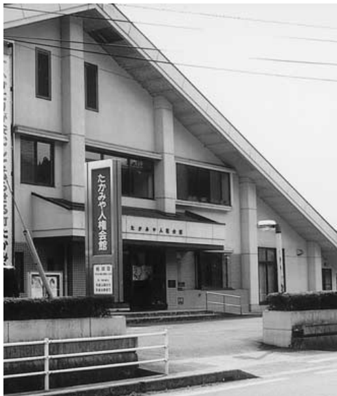
今後も人権を大切にするまちづくり