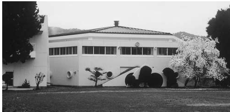
外壁塗装された体育館

市民に親しまれる施設にするため愛称募集したところ約1400通の応募があり、選考委員会で審査の結果、安芸高田市の将来のまちづくりにマッチしたこのネーミングに決定しました。