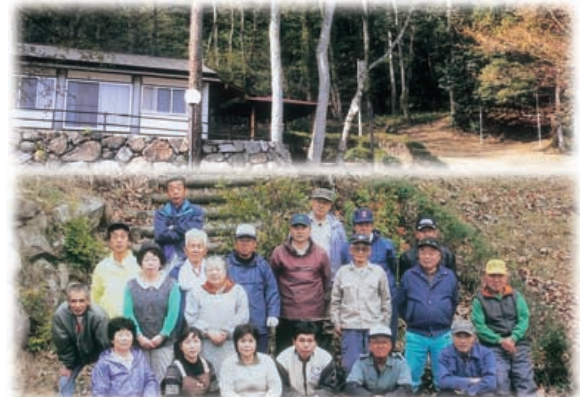
面山森林公園清掃 志部府親交会のみなさん