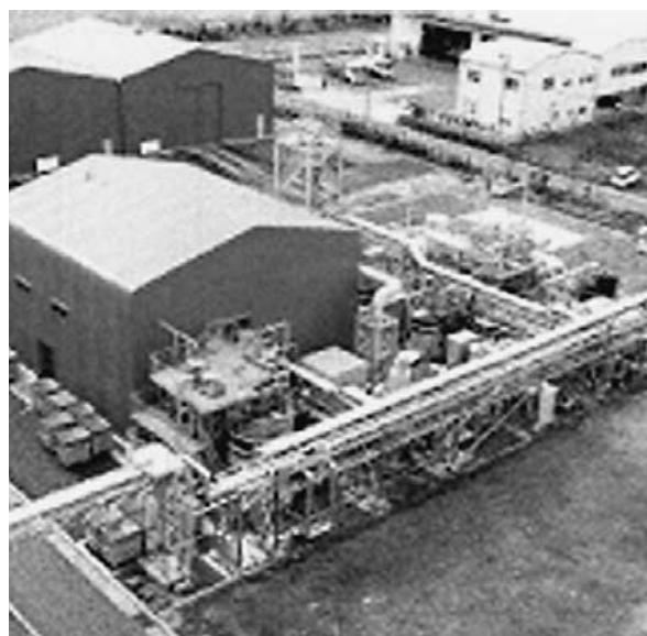
新エネルギーのエタノール化設備

廃油等）、水力、海洋、地熱、波力、温度差、雪氷熱等）による地域経済活性化を目指しており、安芸高田市でもバイオマスの他に雪氷熱、地熱、太陽光等の可能性があることが調査できました。