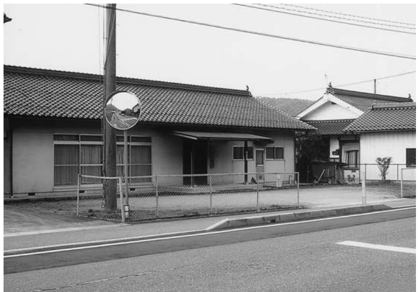
集会所も地元管理の方向に