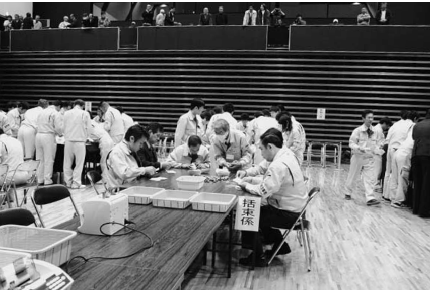
開票作業は職員100名で、集計作業時間は2時間25分で終了