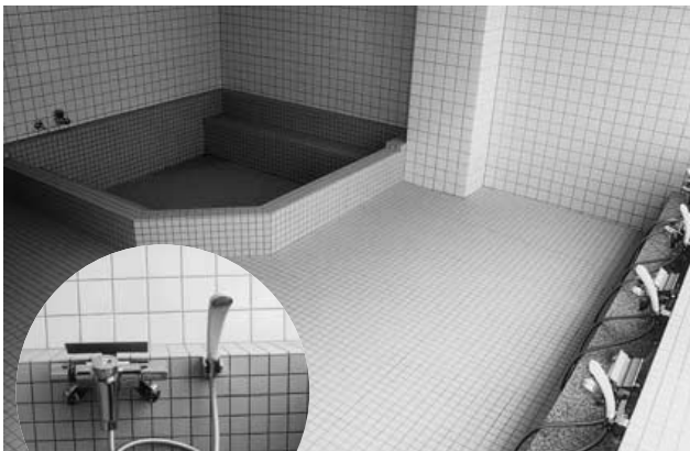
風呂にシャワー設置