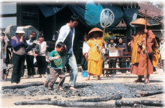
理窓院で火渡り 4月6日