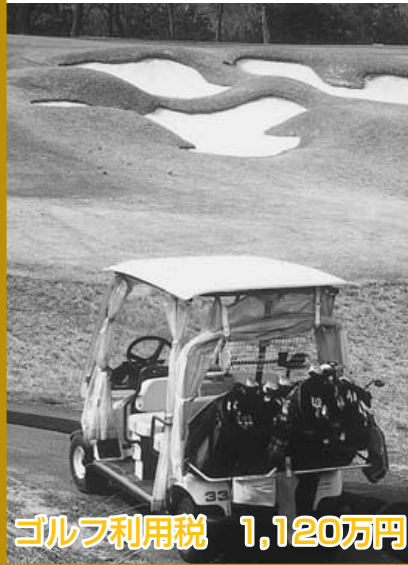
ゴルフ利用税 1,120万円