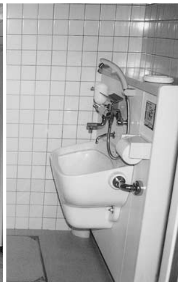
衛生的に改修された施設