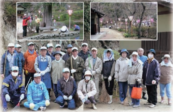
吉田振興会のみなさん 3月23日