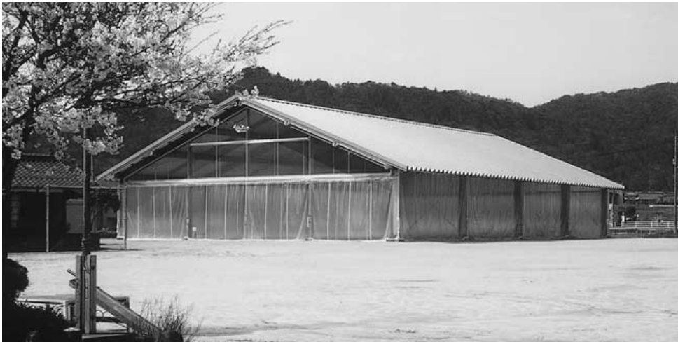
旧横田小学校跡地の振興会拠点づくりに530万円の補正