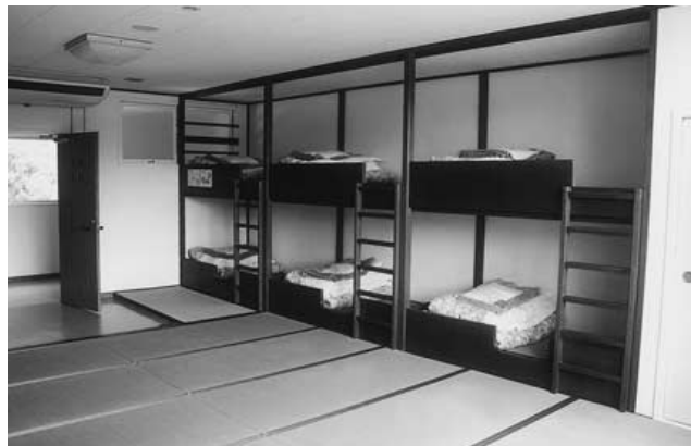
冷房整備された宿泊室