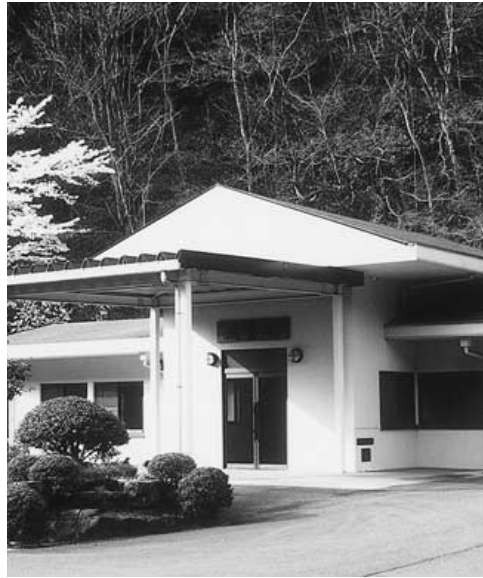
待たれる火葬場整備

市長 ハード事業は、広域葬斎場をのぞき竣工ができ、道路網整備も「東広島高田道路」「可部バイパス」等一定の計画も進み2地域居住が可能な「まち」の実現できそうです。今後「人・輝く安芸高田」を具体化する住民自治組織を基盤にした協働のまちづくりと財政健全化をすすめていただきたいと思います。