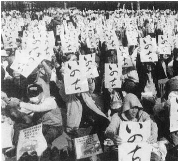
後期高齢者医療制度中止求め

1月に五島市の日本共産党市議団と交流。3月に中国五県の日本共産党議員研修会に参加しました。どこの市町村でも「住民の貧困と格差をどのようにして打開するべきか」議論の主流になりました。後期高齢者医療制度の問題では、地方自治体も住民も、心の底から怒っています。