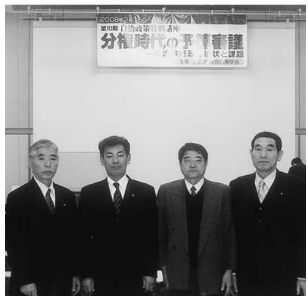
「分権時代の予算審議」研修会場

国では、「自治体財政健全化法」の実施が予定され、基準比率を超えると国の関与のもとで新たな「再建計画」が義務化されるので、予算審議では、市の将来展望を視点に置き議員としての行動を重視していきます。