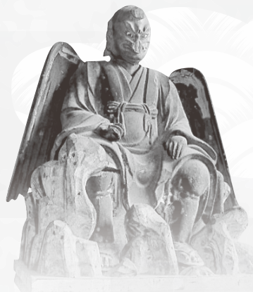
木造 烏天狗像 延享3年(1746) 宍戸司箭神社蔵 (11月4日より展示) 宍戸司箭神社は宍戸家俊を祀る。家俊は修験道の達人として、室町末期の京都で活躍したと伝わる謎多き人物