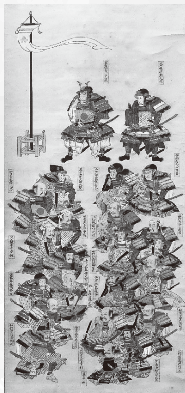
安戸元家御座備図 当館蔵