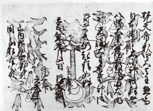
山内家文書 安戸隆家同元孝連署状(部分) 天正8年(1580) 個人蔵 安戸隆家父子が備後の山内氏へ宛てた起請文

〔見どころ〕 ★重要文化財毛利家文書8点(毛利博物館蔵) ★豊臣秀吉朱印状3点(右田毛利家文書) ★初公開となる司箭神社神体の烏天狗像