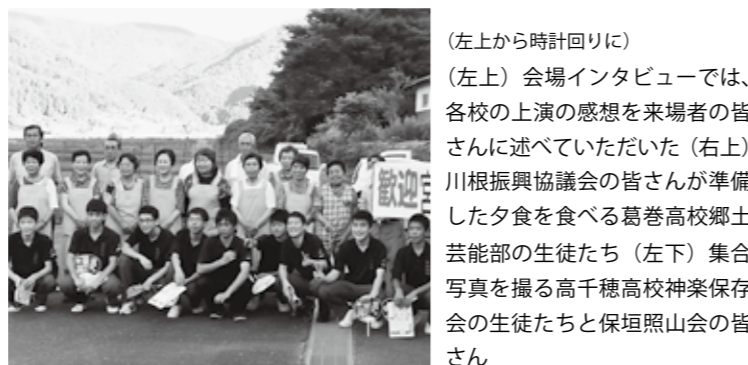
（左上から時計回りに） （左上）会場インタビューでは、各校の上演の感想を来場者の皆さんに述べていただいた（右上）川根振興協議会の皆さんが準備した夕食を食べる葛巻高校郷土芸能部の生徒たち（左下）集合写真を撮る高千穂高校神楽保存会の生徒たちと保垣照山会の皆さん