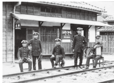
開業当時の向原（むかいばら）駅と駅員（大正4年8月）

開館25周年記念事業 春季企画展 「芸備線開通100年 安芸高田の車窓から」 安芸高田市歴史民俗博物館 ☎42・0070