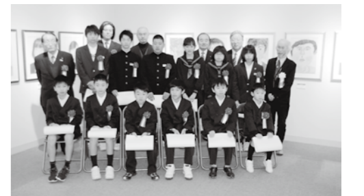
平成27年2月7日 表彰式