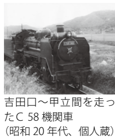
吉田口～甲立間を走ったC58機関車（昭和20年代）

開館25周年記念事業 春季企画展 「芸備線開通100年 安芸高田の車窓から」 安芸高田市歴史民俗博物館 ☎42・0070