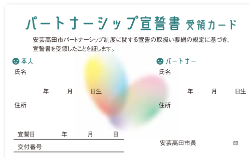
宣誓書受領カード