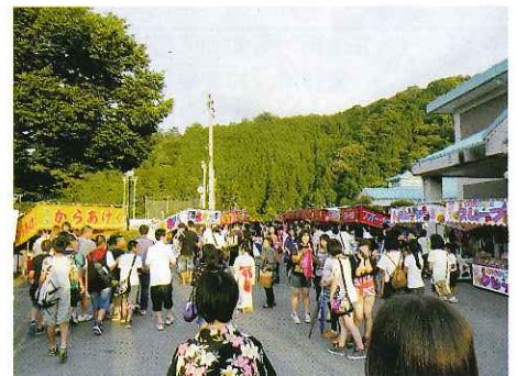
大勢の人々で賑わいました。

【導入の経緯とご利用方法】 元カラオケ店たまちゃんから格安(0円)で譲り受けた機器。 ●使用の仕方は？ ・当面、団体で定期的な使用を望みます。月のうち毎週一回使用で月額一人500円を基準に使用