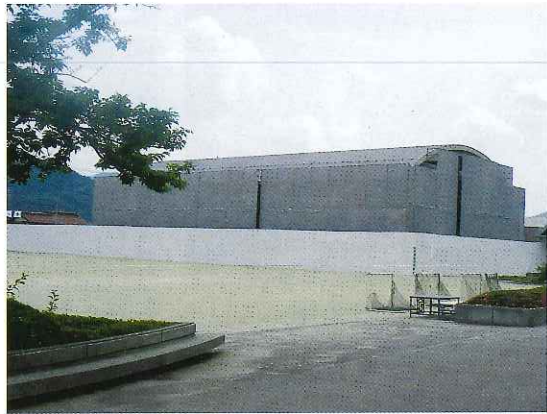
テントに覆われた可愛小体育館

安芸高田市の「学校耐震化推進事業」をうけて、可愛小学校体育館が、現在改築されています。工事の内容は、耐震化の為、館内側面にブレース(筋交い)を張り地震に耐える工法を採用されています。