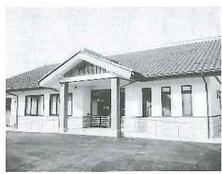
可愛振興センター