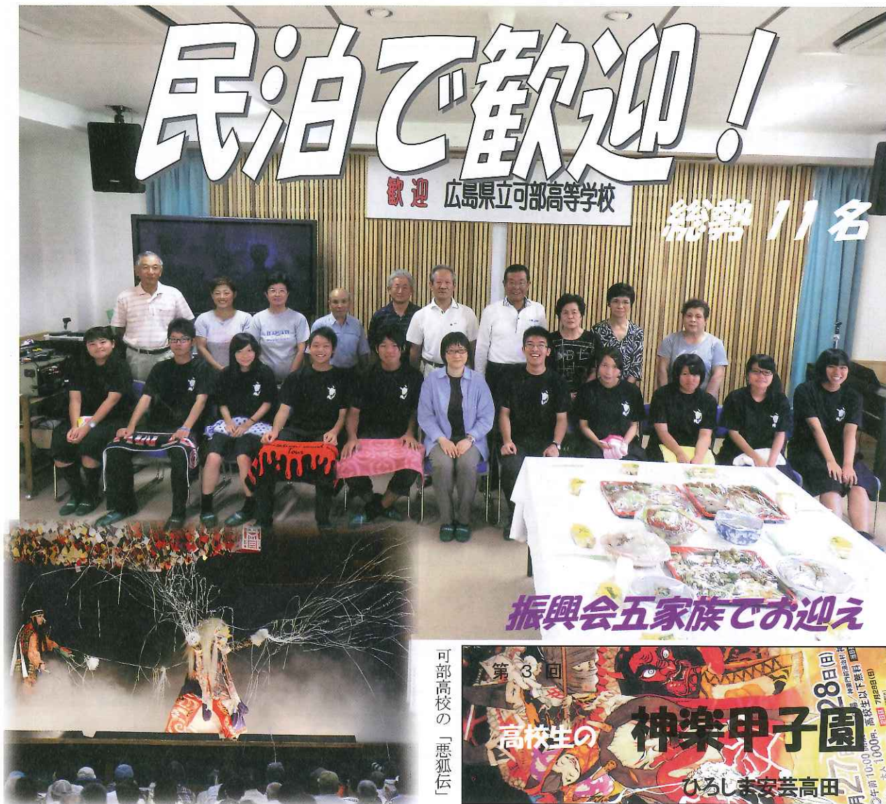
振興会五家族でお迎え