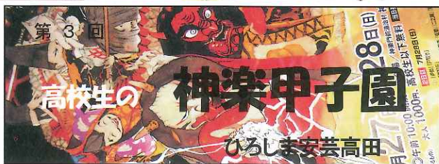
可部高校の「悪狐伝」