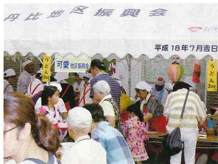
今回の担当はうどん販売。大勢のお客さんのおなかを満足させました。おかげで800食用意したうどん完売でした。