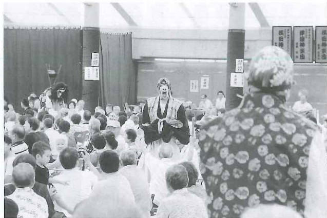
会場内に降りて笑いの渦を巻きおこした、鬼と和尚と観客との掛け合い