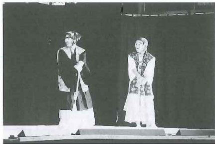
軽妙な演技で二人の和尚が登場